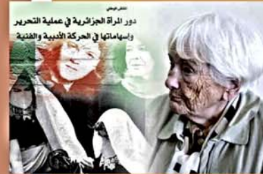
دور المرأة الجزائرية في عملية التحرير وإسهاماتها في الحركة الأدبية والفنية

استقبل السيد مدير جامعة المدينة والسيدة مديرة الخدمات الجامعية أعضاء من المكتب الوطني والمكتب الولائي لطلبة جمهورية الصحراء الغربية الذين جاؤوا في زيارة تفقدية للطلبة الصحراويين بجامعة المدينة.